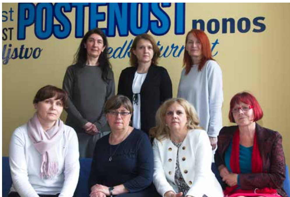
Članice aktiva slovenščine v tem šolskem letu

Obravnavanje književnih del že dolgo ni učenje življenjepisov avtorjev in letnic njihovega rojstva, ampak omogoča osebno doživljanje in odprto razumevanje. Dijaki razvijajo doživljajske, domišljjsko ustvarjalne, vrednotenjske in intelektualne zmožnosti, ki bogatijo njihovo osebnost in so sestavina estetske zmožnosti. Umetnostna besedila poiščejo v šolski knjižnici, dijaškem zatočišču, ki je srce vsake šole, kjer s svojimi nasveti z veseljem priskoči na pomoč katera izmed knjižničark, ki ni samo spodbudnica bralne kulture, ampak aktivno sodeluje v vzgojno-izobraževalnem procesu.