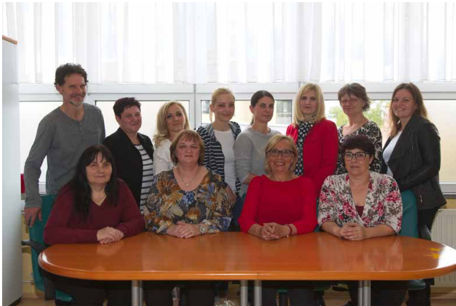
Administrativni, računovodski in tehnični delavci z vodstvom šole