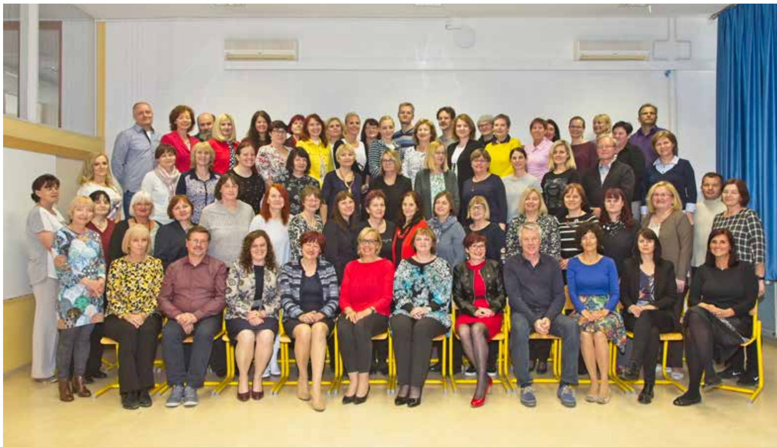
Kolektiv Gimnazije in srednje šole