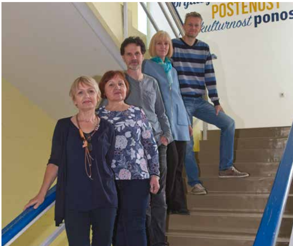
Člani aktiva informatike v tem šolskem letu