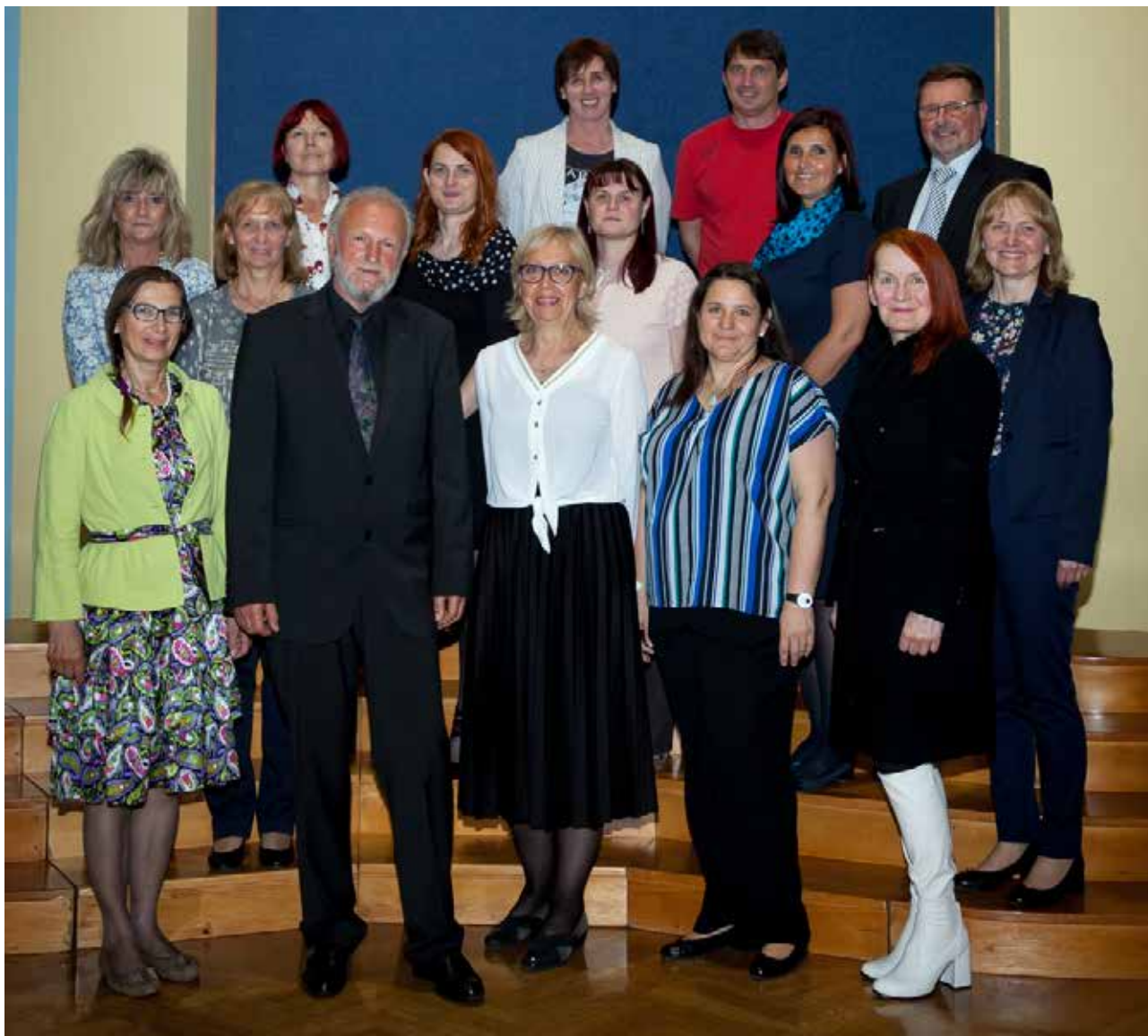
Kolektiv Višje strokovne šole